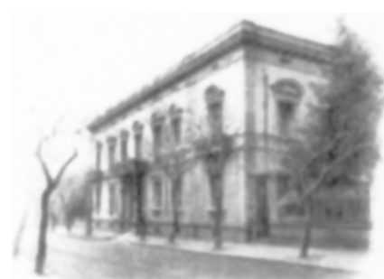
Fondazione Antonio Segni

Sassari 22 giugno 2018: 18,00 Fondazione di Sardegna via C. Alberto 7